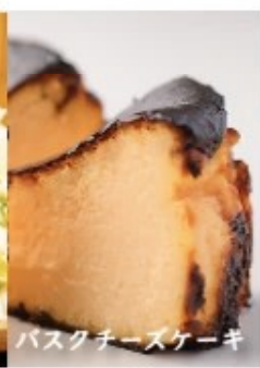
バスクチーズケーキ