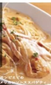
スカンビエビの アメリカンソーススパゲティ