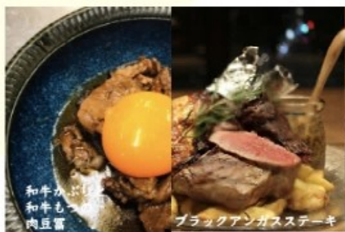
和牛かぶり 和牛もつ 肉豆腐

オードブル5000と佐渡産活魚のアクアパッツァの2段に自家製サイコロパンも入った豪華版！